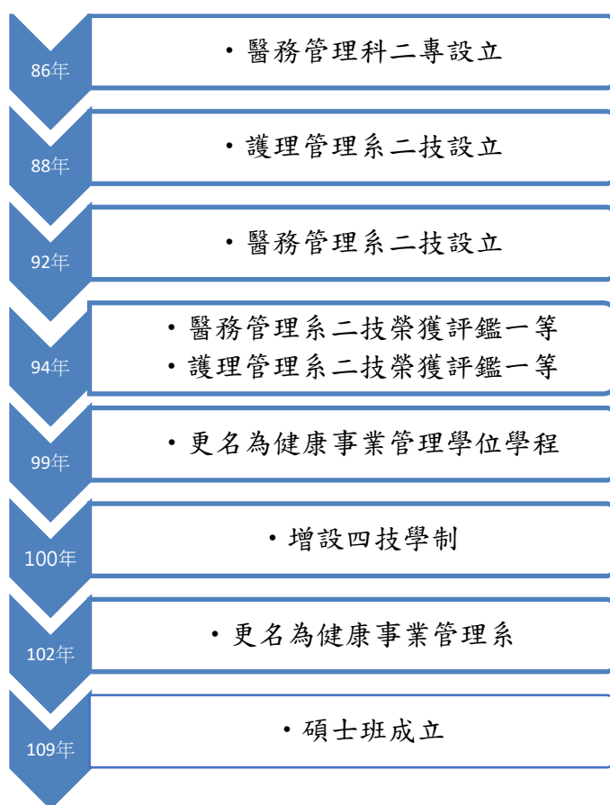
圖 健康事業管理系歷史沿革

本校 86 學年度獲准改制為輔英技術學院，開始招收醫務管理科二專學生(此為本系前身)， 筆路藍縷至今已有 25 年的歷史。88 學年度本系開始招收護理管理系二技學生、92 學年度同時招收醫務管理系二技學生。民國 94 年本校第一次接受科技大學專業系所評鑑，醫務管理系與護理管理系難能可貴地同時榮獲評鑑一等(全校只有四個系一等)的優良成績，除顯示外界對本系用心辦學成果的肯定外，自此以後，跟隨先進腳步，戮力於教學、輔導、產學與研究的精進，亦為本系師生念茲在茲的優良傳統與發展的核心價值。自 99 學年度起，配合健康產業的發展趨勢，本系將醫務管理與護理管理相關資源進行整併，以「健康事業管理學位學程」繼續培養更多符合健康產業需求的專業人力。100 學年度增設四技學制，102 學年起更名為「健康事業管理系」，109 學年度起成立碩士班。