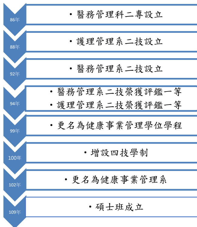
圖 健康事業管理系歷史沿革

本校 86 學年度獲准改制為輔英技術學院，開始招收醫務管理科二專學生(此為本系前身)， 筆路藍縷至今已 25 年的歷史。88 學年度本系開始招收護理管理系二技學生、92 學年度同時招收醫務管理系二技學生。民國 94 年本校第一次接受科技大學專業系所評鑑，醫務管理系與護理管理系難能可貴地同時榮獲評鑑一等(全校只有四個系一等)的優良成績，除顯示外界對本系用心辦學成果的肯定外，自此以後，跟隨先進腳步，戮力於教學、輔導、產學與研究的精進，亦為本系師生念茲在茲的優良傳統與發展的核心價值。自 99 學年度起，配合健康產業的發展趨勢，本系將醫務管理與護理管理相關資源進行整併，以「健康事業管理學位學程」繼續培養更多符合健康產業需求的專業人力。100 學年度增設四技學制，102 學年起更名為「健康事業管理系」，109 學年度起成立碩士班。